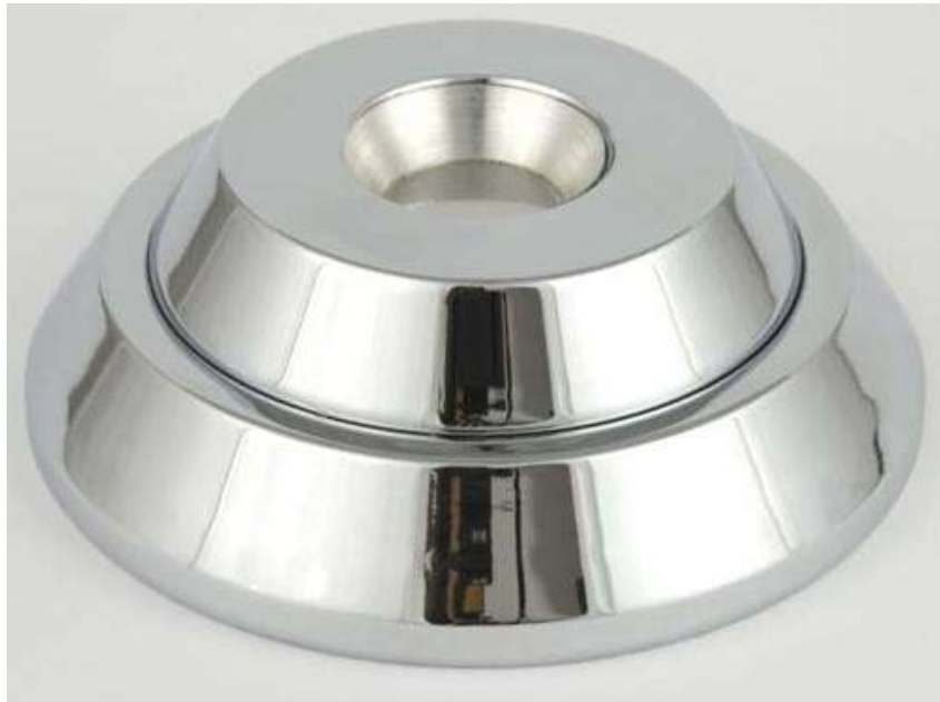
6. ábra. Etikett nyitó 6

A kereskedelmi munkát segíti, a szakszerű és biztonságos elhelyezést garantálja, ha a biztonsági címkét már a gyártónál, esetleg a nagykereskedelemben teszik fel a termékre. Ezt nevezi a szakirodalom forráscímkézésnek . A forráscímkézés az ellátási lánc szerves része, lehetővé teszi a gyártóknak, hogy megvédjék a termékeiket, és rögtön polcra helyezhető kész termékeket adjanak át a kiskereskedőknek. A forráscímkézés lehetővé teszi a rejtett címkék alkalmazását, biztosítja a címkézés előírásos elvégzését, és elkerülhetővé teszi a csomagolás megbontását, illetve az újracsomagolást.