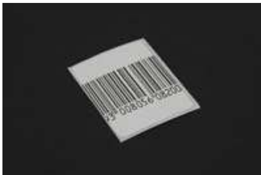
11. ábra. Álvonalkódos címke 12

A másik jellemző rögzítési mód a pánt vagy zsineg alkalmazása. Ilyenkor legtöbbször a többi függőcímkéhez kapcsolják, illetve azzal együtt rögzítik a vagyonvédelmi címkét is, ezért a címke a függőcímkékre jellemző tartalommal kerül nyomtatásra. Tartalmazhatja például az üzlet adatait, vagy külön az anyagösszetételt, méretet, árat vagy más kapcsolódó információt.