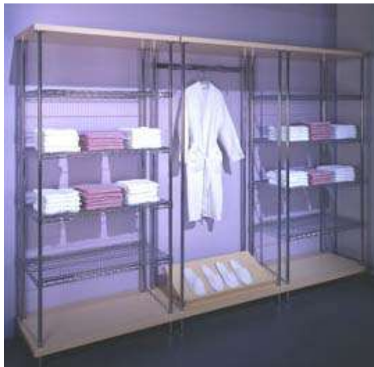
1. ábra. A magas polcokat a fal mellé tegyük!

A bolti lopások megakadályozásának leghatékonyabb eszköze a megelőzés. Ez elérhető azzal is, hogy megfelelően alakítjuk ki az üzlet belső rendjét. Az árutároló, bemutató eszközöket úgy helyezzük el, hogy az üzlet egyes pontjairól nagy területet beláthassunk. Ruházati üzletekben a magasabb állványokat, sztendereket a falak mellé érdemes elhelyezni. Ezekre tárolhatunk hajtogatott és vállfás árukat. Középre inkább alacsonyabb állványokat, sztendereket, felülről nyitott pultokat helyezünk el, mert a magas berendezési tárgyak, árubemutató eszközök csökkentik a tér beláthatóságát, ráadásul még nyomasztóan is hatnak.