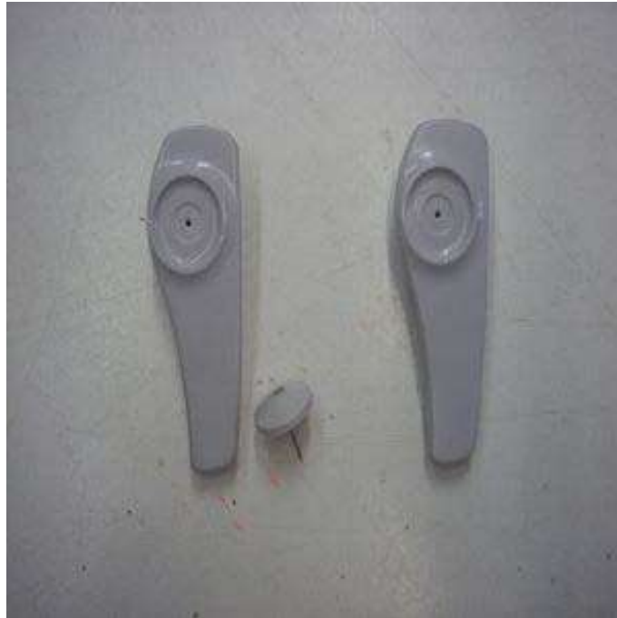
13. ábra. Kemény etikett 14

Elhelyezésekor különösen vigyázni kell, nehogy megsérüljön a ruha, meghúzódjon egy szál, vagy kiszakadjon az anyag.