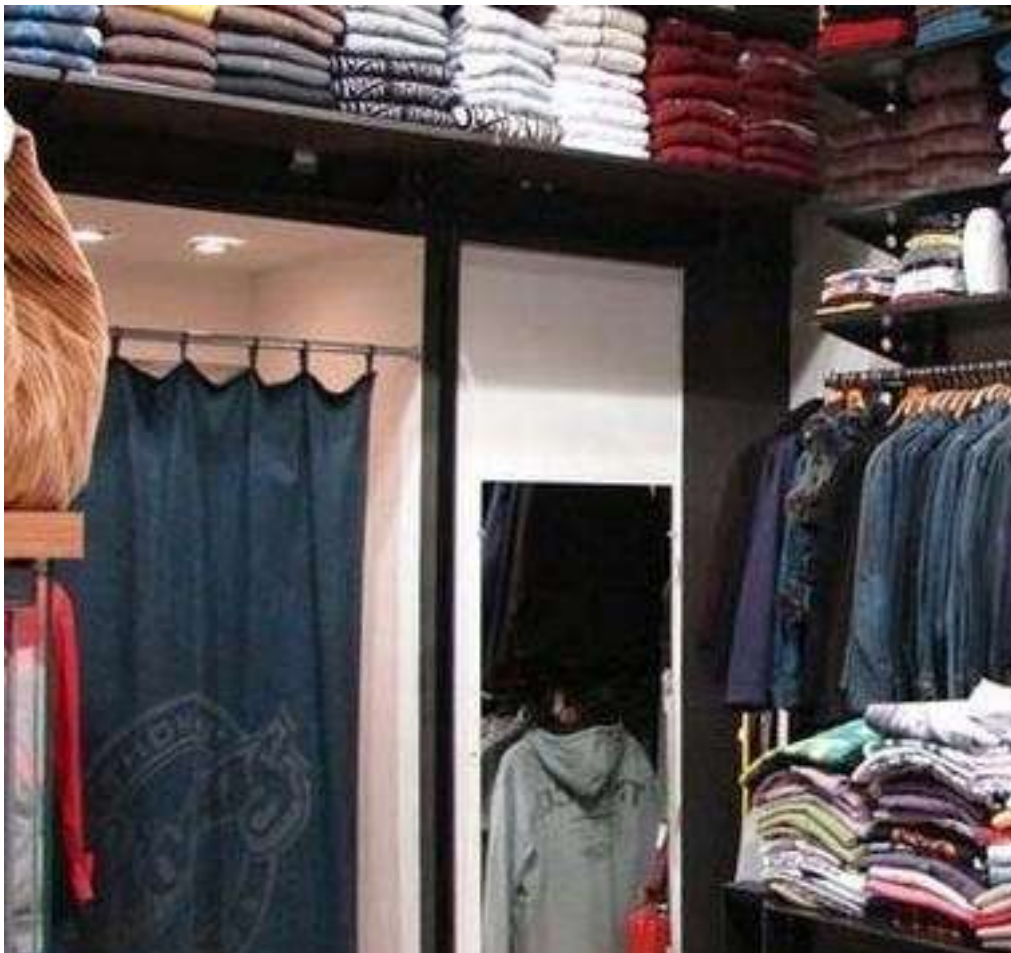
2. ábra. Boltbelső próbafülkével 2

A konfekció-, kötött- és divatáruüzletekben fontos szervezési feladat a próbafülke fokozott figyelemmel kísérése . Nagyobb forgalmú üzleteknél jellemző, hogy a próbafülke környékén külön eladó dolgozik. Ő segíti a tájékozódást, esetleg várakozás közben tanácsot ad a vevőnek. Egyre több helyen ellenőrzik és korlátozzák a bevihető darabszámot. A vevő a nála lévő ruhadarabok számának megfelelő kártyát kap, amit próba után vissza kell adnia. Ezzel könnyen ellenőrizhető a bevitt és kihozott mennyiség. Ha nem adunk a vevőnek kártyát, akkor is előnyös, ha a próbafülke környékén mindig tartózkodik egy eladó. A vevők tájékoztatása mellett figyelemmel kísérheti a próbafülke körüli mozgásokat, ami a vevők elégedettségét és a vagyonzbiztonságot is növeli.