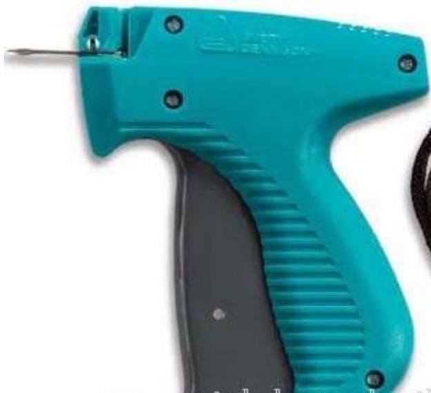
12. ábra. Szálbelövő pisztoly zsineges rögzítéshez 13

A másik jellemző rögzítési mód a pánt vagy zsineg alkalmazása. Ilyenkor legtöbbször a többi függőcímkéhez kapcsolják, illetve azzal együtt rögzítik a vagyonvédelmi címkét is, ezért a címke a függőcímkékre jellemző tartalommal kerül nyomtatásra. Tartalmazhatja például az üzlet adatait, vagy külön az anyagösszetételt, méretet, árat vagy más kapcsolódó információt.