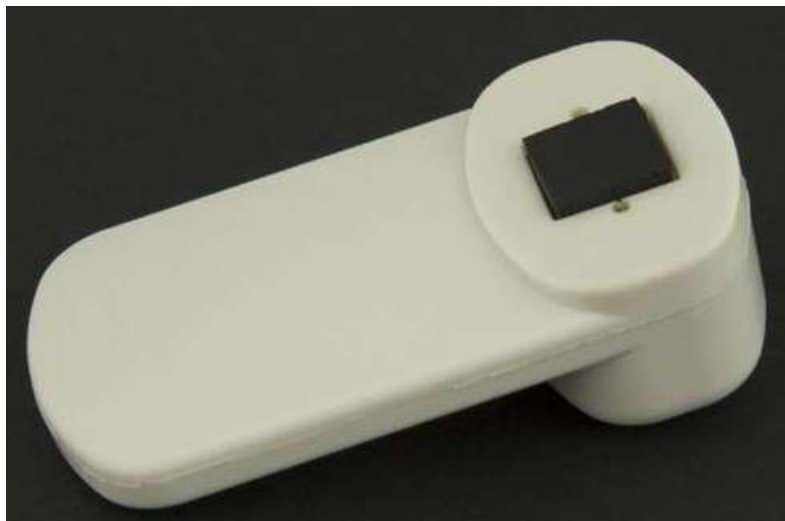
5. ábra. Műanyag etikett 5

A címkék lehetnek egyszer használatosak, amit a termékhez tájékoztató címke, vonalkód, álvonalkód vagy más címke formájában kapcsolunk, és a dekódolás után a termékkel együtt elhagyják az üzletet. Ezek egyszerű kivitelűek, papíralapúak, az áruhoz műanyag szállal vagy zárgombbal rögzíthetők, de kaphatók öntapadós változatban is. A szaknyelv ezeket a címkéket hívja puha címkének.