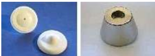
14. ábra. Etikett és a hozzá tartozó nyitó 15

A dekódolás során egy az adott technikához kapcsolódó dekóder segítségével hatástalanítjuk a címkét, megszüntetjük az elektromágneses vagy rádiófrekvenciás jelet. Ha forráscímkézéssel került fel a jel a termékre, akkor rendszerint figyelmeztetjük a vevőt arra, hogy érdemes a bevarrt forráscímkét kivágni. Ha megnézzük a bevarrt címkét, akkor a forráscímkén látható egy olló, ami szintén azt jelzi, hogy ajánlatos eltávolítani az áruvédelmet. Az üzletben feltett áruvédelmi címkét is érdemes később eltávolítani a vevőnek. Vannak olyan áruvédelmi címkék, amit az üzletben helyezünk el a terméken, de ott el is távolítjuk. Ezek a címkék jellemzően kiegészítik a függőcímkéket, de nincs rajtuk olyan információ, amit a többi címke ne tartalmazna.