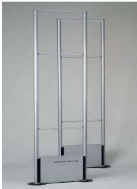
8. ábra. Áruvédelmi antenna 8

Az áruvédelmi rendszer utolsó eleme az antenna. Az antenna hivatott érzékelni, hogy az adott termék kivihető, vagy sem. Ha az áruvédelmi címke nincs aktiválva vagy eltávolították, akkor a rendszer nem jelez, ellenkező esetben megtörténik a riasztás. A riasztás történhet fény- vagy hangjelzéssel. Az antennát úgy kell elhelyezni, hogy a vevő mindenképpen elhaladjon a hatósugarában.