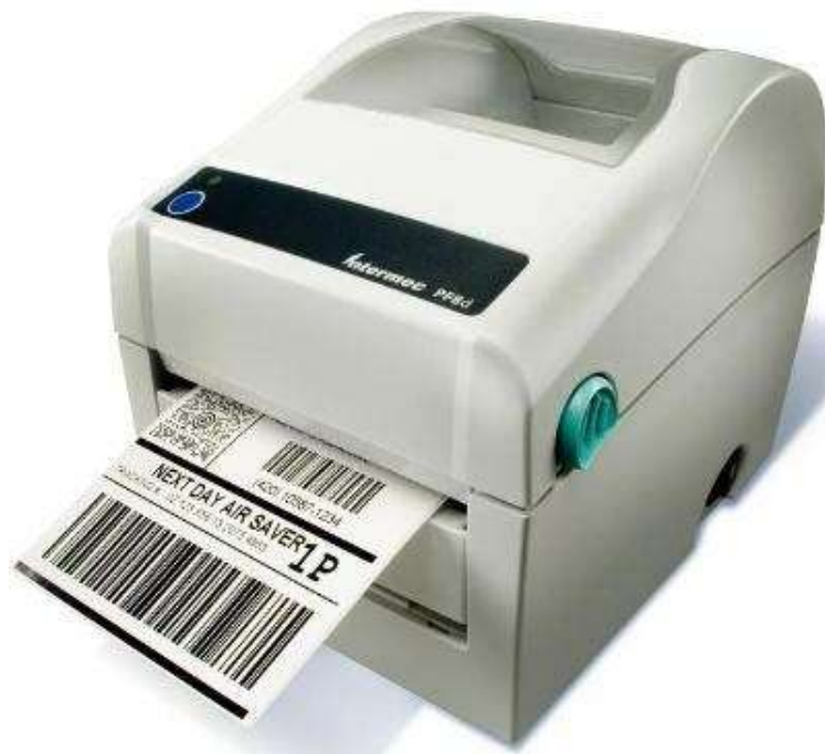
10. ábra. Etikettnyomtató 11

Fontos, hogy a rögzítés ne legyen eszköz nélkül könnyen oldható, és a rögzítés helye azonos fajta ruházati termékeknél azonos helyen legyen. Ezzel segítjük az eladók és a pénztárosok munkáját, így hatástalanításakor pontosan tudják, hogy melyik terméknél hol keressék a címkét. Ezen kívül figyelni kell arra is, hogy az áruvédelmi eszköz ne rontsa a termék összképét, ne akadályozza a ruha felpróbálását.