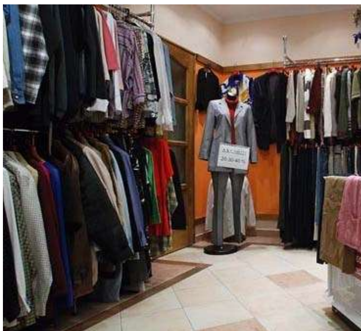
3. ábra. Önkiszolgáló értékesítési mód 3

Jól alkalmazható és vagyonbiztonsági szempontból is előnyösebb az önkiválasztó értékesítés. Cipőknél több helyen kedvelt megoldás, hogy minden fazonból csupán egy méretet, vagy több méretben, de csak fél pár cipőt helyeznek ki. A választás után kérheti a vevő a neki megfelelő méretet, illetve a cipő másik felét is.